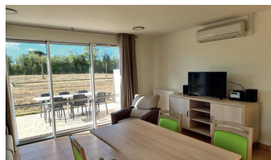
Appartements actuels en colocation